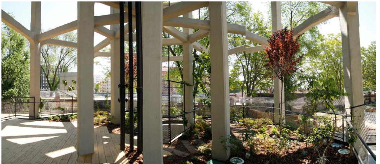
Panoramic views of “Depósito de especies”, located under the elevated water tank